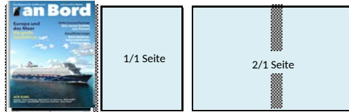
Titelseite 210 x 297 mm A: 210 x 297 mm S: 173 x 257 mm 6.995,- Euro 1/1 Seite A: 210 x 297 mm S: 173 x 257 mm 6.995,- Euro 2/1 Seite A: 420 x 297 mm S: 173 x 257 mm 12.500,- Euro